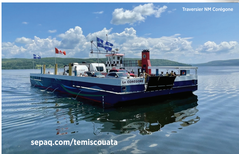
Traversier NM Corégone